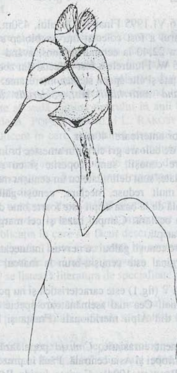
Fig. 1. Armătura genitală ♀ la Cucullia mixta lorica RONKAY & RONKAY 16.VI.1995 Finațele Clujului, 450m (leg. L.Rákossy)

Biologie: După frații RONKAY, diferitele populații de C.mixta ocupă habitate și au o ecologie diferită. Subspecia nominală are două generații (IV-V și VIII), adulții vizitează florile de Acaccia , Scabiosa și Tamarix , fiind rareori atrași de lumina artificială. Subspecia lorica are o singură generație (V-VI). Larva a fost recent descoperită și ilustrată (Ronkay & Ronkay 1994). După cei doi autori, larvele se hrănesc cu flori de Aster , preferând pe cele de A.linosyris , ajungând la maturitate la începutul lui septembrie.