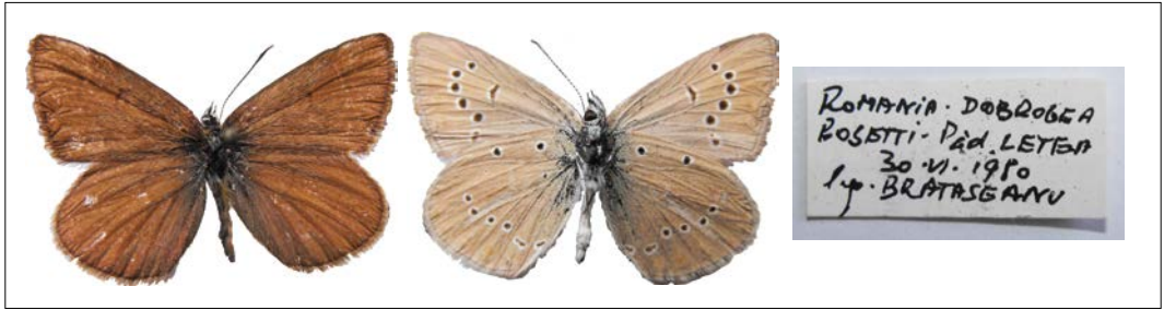
Fig. 2. Polyommatus ripartii din colecția dr. F. König (leg. M. Bratășeanu, Pădurea Letea).