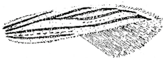
Fig. 1. Coleophora gageai nov. sp. - Desenul aripilor anterioare (Orig.)

dungile mediană și cubitală lat, evidente cu ochiul liber. Nervurile mediană și cubitală sunt marcate prin linii subțiri negricioase și puncte de aceeași culoare. La C. argentula Stph. aceste nervuri sunt mai puțin marcate. Puncte de solzi negri se găsesc și pe restul nervurilor. Franjurii aripilor anterioare sunt cenușiu deschis. Aripile posterioare sunt cenușii închis cu franjuri de aceeași culoare. (Fig. 1).