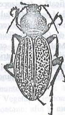
Fig. 1. Carabus coriaceus rugifer ♂, atavism unilateral al sculpturii elitrei stângi / Left elytron sculpture atavism(Orig.).

primul de la Arcalia (jud. Bistrița-Năsăud), 10.07.1992, Leg. A. RUCĂNESCU, al doi-lea de la Poșaga (Munții Apuseni), 18.08.1997, Leg. A. RUCĂNESCU și un exemplar de Carabus (Euca-