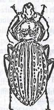
Fig. 3. Carabus ullrichi ullrichi ♀, alterare simetrică a sculpturii elitrelor / Symmetrical alteration of elytra sculpture (Orig.).

elitre și din câte o punte transversală formată din mici granule între primul și al trei-lea interval primar (Fig. 3).