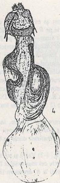
Fig. 4. Armătura genitală ♀ la Rhyacia simulans / Female genitalia of Rhyacia simulans