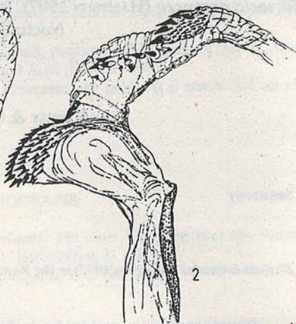
Fig. 2. Rhyacia simulans - vezica evaginată / Evaginated vesica of Rhyacia simulans