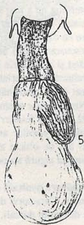
Fig. 5. Armătura genitală ♀ la Rhyacia arenacea / Female genitalia of Rhyacia arenacea