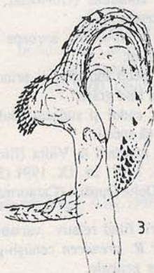
Fig. 3. Rhyacia arenacea - vezica evaginată / Evaginated vesica of Rhyacia arenacea