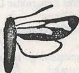
Fig. 1. Zygaena minos D. & S.

Cele două specii se pot deosebi cu ușurință după structura armăturii genitale (FORSTER & WOHLFAHRT 1960). Pata roșie dinspre marginea costală, poate da, prin forma ei, la exemplarele proaspete, indicii pentru a separa cele două specii (Fig. 1). Totuși acest caracter luat în considerare unilateral nu poate fi considerat niciodată sigur, fapt pentru care prezentăm și armătura genitală pentru cele două specii (Fig. 3, 4).