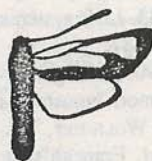
Fig. 2. Zygaena purpuralis BRÜNN.

Dificultatea determinării celor două specii a cauzat neșemnalarea lui Z. minos din fauna României și cunoașterea incompletă a răspândirii acestuia. Probabil specie sudest-europeană, Z. minos a fost semnalat din Grecia (ssp. diaphana ), Ungaria (FAZEKAS 1983, 1990), Cehia, Slovacia, Polonia, Țările de Jos, Sudul și centrul Peninsulei Scandinave, Austria (HUEMER & TARMANN 1983), Italia, Germania (ZUB 1996), Elveția (RESER-REZBANYAI 1994) și Franța (FAILLE 1994).